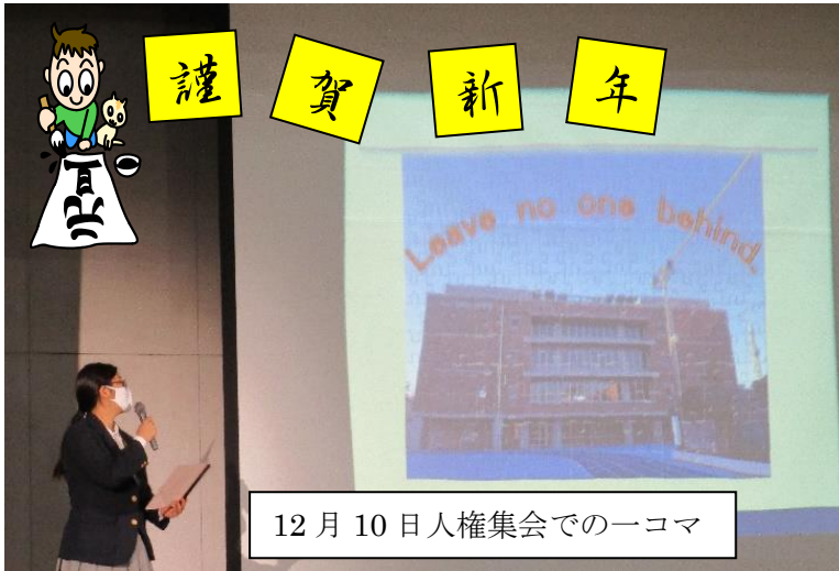
12月10日人権集会での一コマ