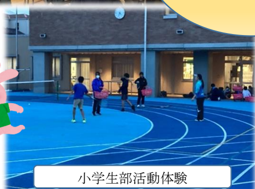
小学生部活動体験