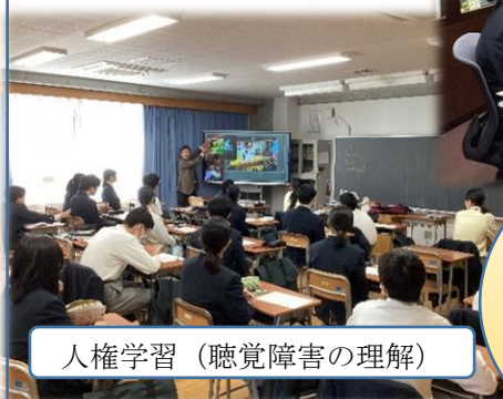
人権学習 (聴覚障害の理解)