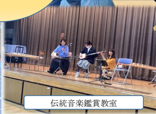
伝統音楽鑑賞教室