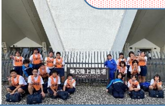
東京都特別支援学校学級 陸上競技大会