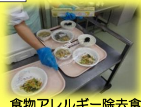
食物アレルギー除去食