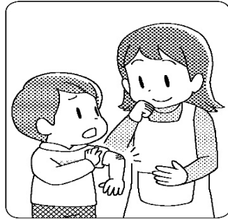
けがをしたところや痛みのあるところを伝えよう