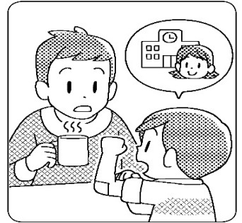
保健室に行ったことを家の人に話そう