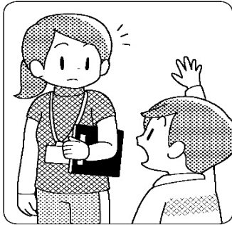
先生に知らせてから保健室に行こう