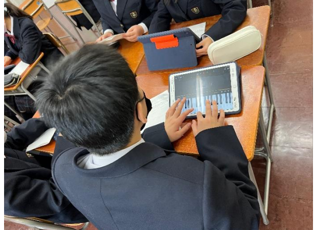
1年 音楽科 創作 自分の名前を使った作曲活動