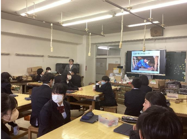
1年 技術科 材料と加工の技術 カメラを使ったカンナ削りの姿勢の確認・訂正