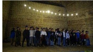
1日目 大谷石 華厳の滝

ぜひ、今回の学びを学校生活へとつなげ「錦糸小学校の顔」として、今後も活躍してほしいと願っています。