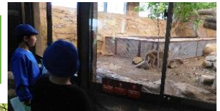
1日目 那須どうぶつ王国