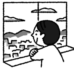
たまには遠くの景色を眺めてリラックス