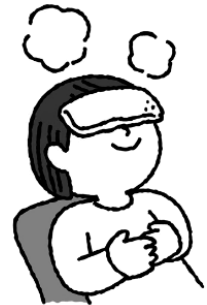
目が疲れたときは蒸しタオルなどで温める