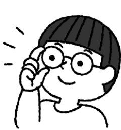
メガネ、コンタクトは自分の度にあったものに