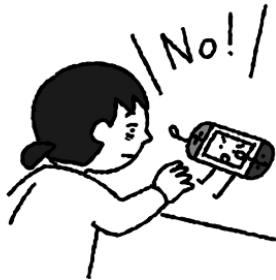
ゲームやスマホの見すぎに注意