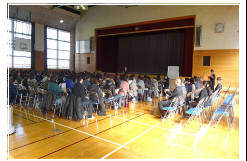
<本校体育館で実施した新入生保護者説明会>

統合新校「桜堤中学校」の新入生保護者説明会を向島中体育館で行いました。両校の校長ならびにPTA会長の挨拶に始まり、教務・生活・進路の各主任から「教育内容」や「きまり」についての説明がありました。保護者会に欠席された方には、児童の在籍校の担任を通じて配付資料をお配りいたしました。なお、本校や鐘淵中または桜堤中のホームページでもご覧になることができます。また、2月24日(日)には、午前：鐘淵中で、午後：向島中で新入生標準服の採寸を行いました。当日都合がつかず採寸できていない方は、早めに取り扱い業者に行つて採寸するようお願いいたします。詳しくは配布した書類をご覧ください。