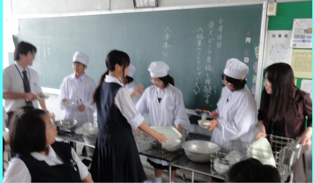
▲複数教員による指導