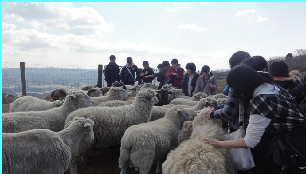
▲羊の群れの扱い方の体験