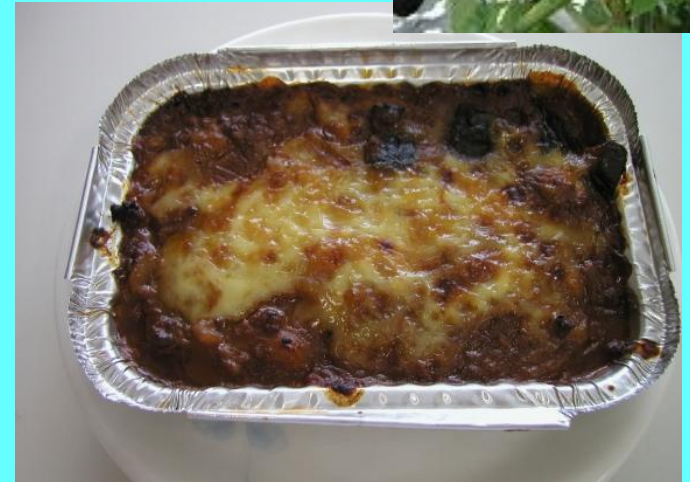
▲献立 なすのムサカ風