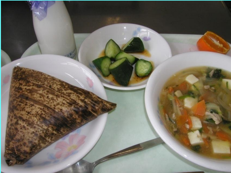
▲行事食(こどもの日)