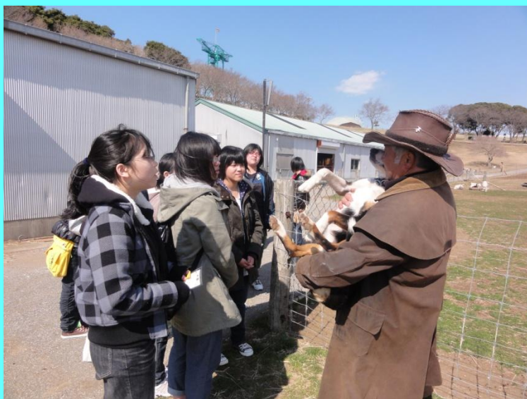
▲担当者による指導