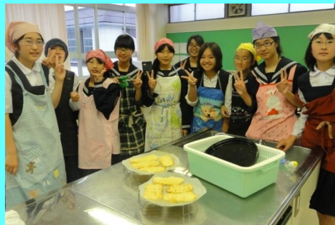
▲ナンが焼けました