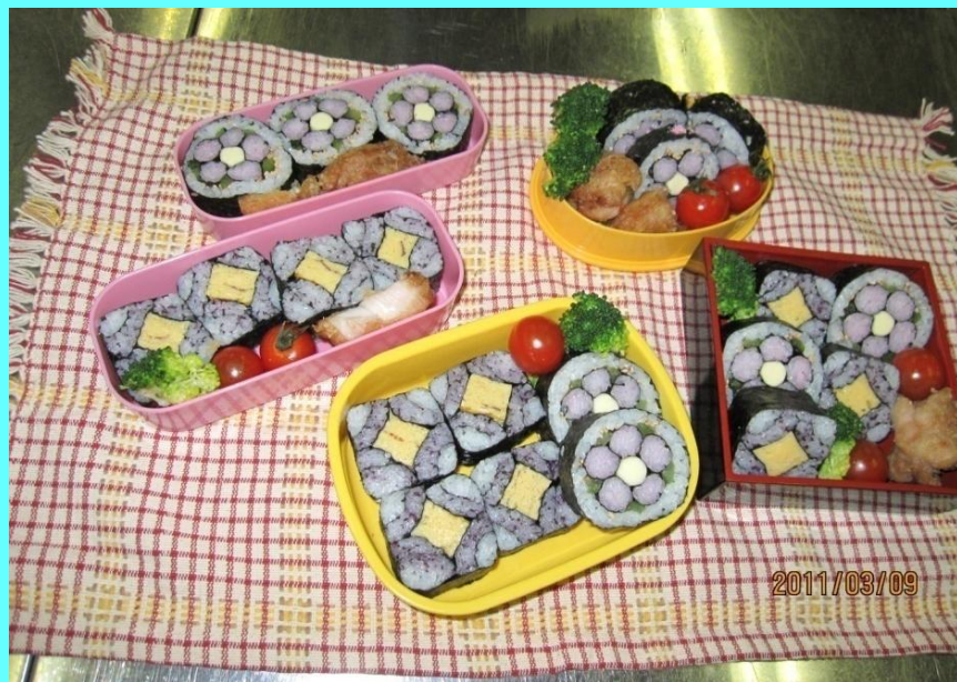
▲選択家庭科・部活動合同弁当作り