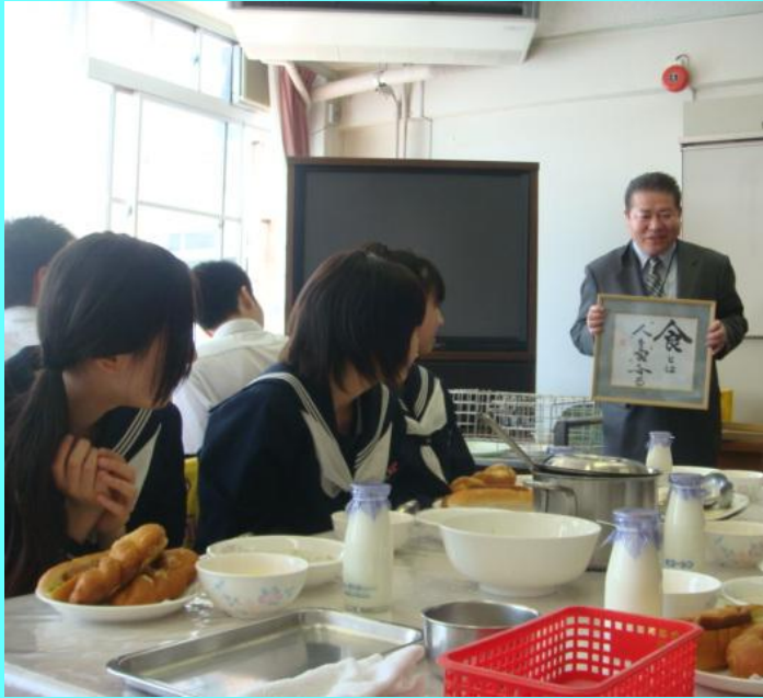
▲ランチルームにおける 校長との会食