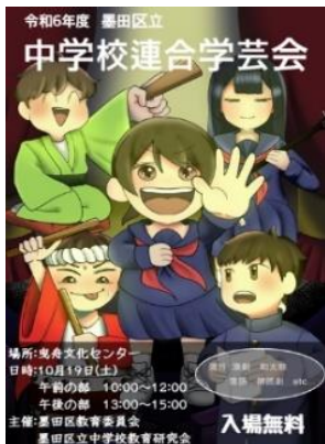
区内掲示ポスター

後半は、「世界に羽ばたく両中生」の先陣を切って、将来行ってみたいくなるような海外派遣報告をしてくれました。都大会「金賞」受賞の吹奏楽部は、演出効果もあり会場が一つになって楽しめ、もう2～3回アンコールが欲しいくらいでした。19日に区連合学芸会で都大会出場校となった演劇部の演技は、会場全体を演目の世界に引き込みました。このように、様々な行事を充実させ成功を収めてきた両中生の「文武両道」がしっかりと証明された10月でした。これまで支援・指導してくれた教職員をはじめ、サポートいただいているPTA役員の皆様に感謝申し上げます。