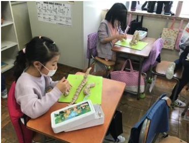
真剣に取り組んでいます

一人一人が想像力を働かせ、個性豊かな「ぐあなご」が完成し、それをタブレットで写真に撮りました。みんな楽しく取り組み、様々な作品が生まれていました。