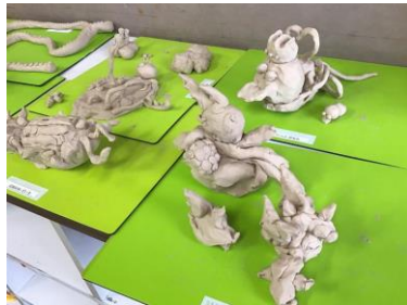
いろんな「ぐあなご」