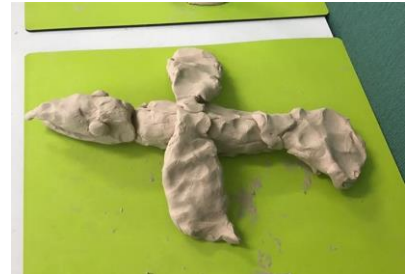
羽がある「ぐあなご」

4月22日に「一年生を迎える会」を行いました。アサガオが成長する様子を表現しながら、アサガオの種をプレゼントすることができました。