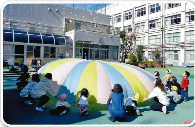
親子でのふれあい活動