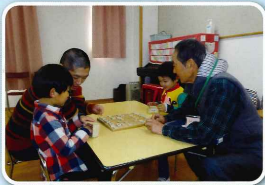
ふれあい会「おじいちゃんと勝負!」