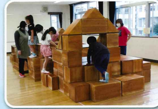
「みんなのお家が完成!」