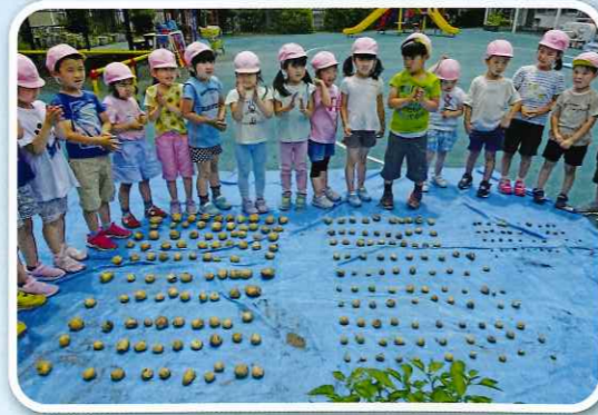
ジャガイモ収穫「すごい! 240個!!」