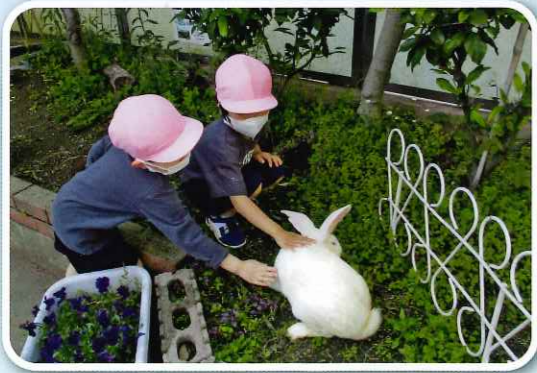
「うさぎさん、かわいいね」

自然に触れて感動する体験を通して、好奇心や探究心、命を大切にする気持ちを育みます。