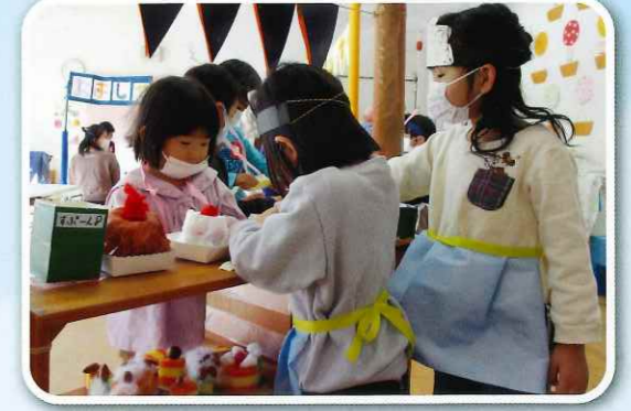
「次は誰がお店の人になる?」