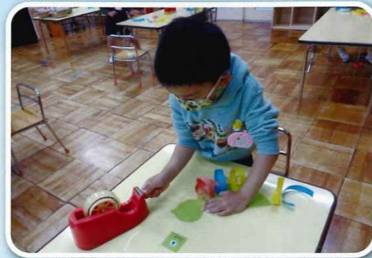
「すてきな鳥をつくろう」