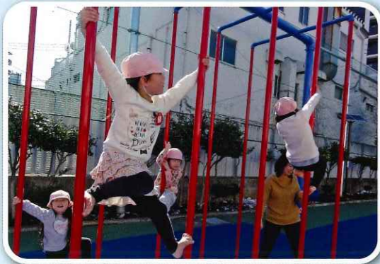
「絶対ゴールするぞ!」