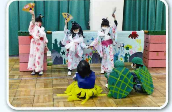
「私たちの踊り、すてきでしょ」