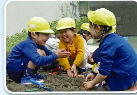
「楽しいね」「面白いね」