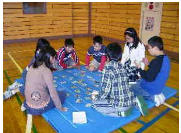
集中してカルタを見つめる目 読み手も聞き手も真剣そのもの

年が明けると、1月26日(土)には立花小学校、2月9日(土)には第一吾嬭小学校の閉校式及びお別れ会がそれぞれ行われます。準備を進めていく中で、それぞれの学校に深く関わってくださった地域の方々を初め、墨田区や旧職員の方々、保護者の方々など多くの方々に支えられてここまで歩んでこられてことを改めて痛感し、感謝の念を強く感じています。閉校式当日も多くの方のお力をお借りいたしますが、どうぞよろしくお願いたします。