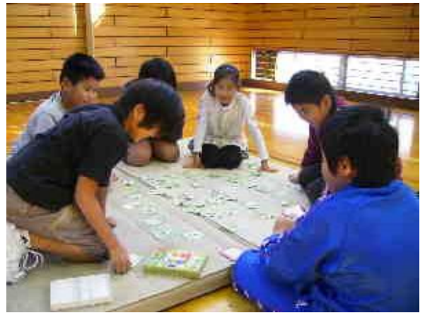
読み手の声に耳をすませて聞く子ども達