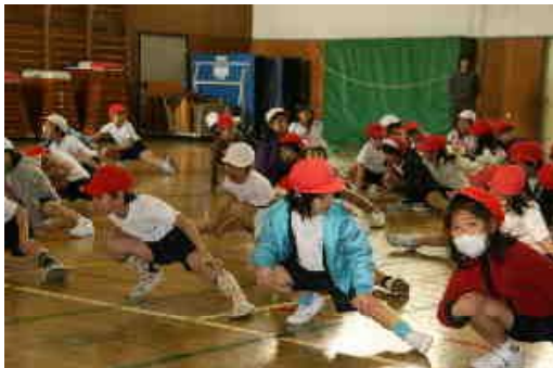
念入りに準備体操をしておこう