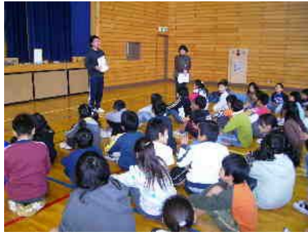
説明を聞く子ども達

2校が混合8グループに分かれて行われたカルタ大会。マットが敷かれたそれぞれのグループの場所で大きい歓声をあげながらの熱戦が繰り広げられました。