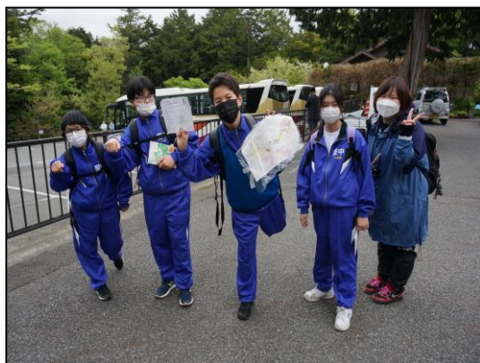
オリエンテーリング 氷穴前にてチェック！

5月12日（木）・13日（金）、1学年は野外体験に行ってきました。場所は、富士山麓に広がる富士五湖の一つ、山中湖近くの井戸前旅館です。ここで火起こし体験、運動会練習、オリエンテーリング、ネイチャーガイド体験など多くの自然に触れる体験をしてきました。家庭から離れ、集団での宿泊活動を通し、親交を深めたり自立心を養ったりしました。