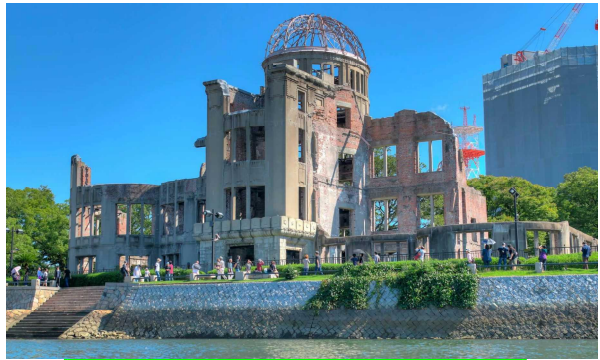
せかい いさん げんばく 世界遺産：原爆ドーム