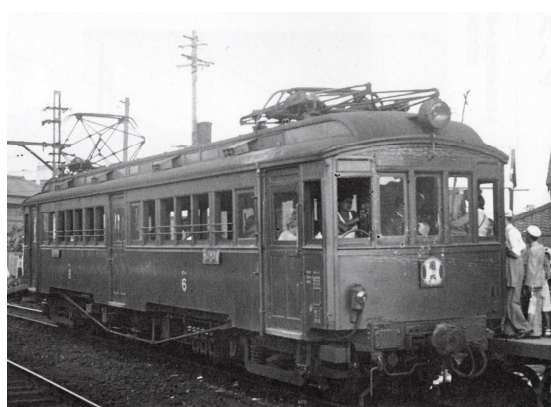
むかし りょう いま りょう 昔は「 1両 」、今は「 2両 」。