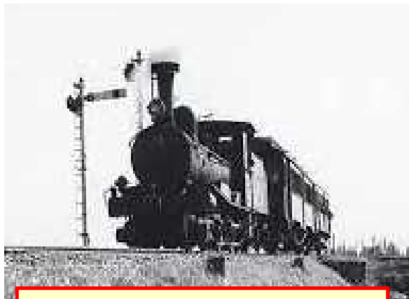
じょうき きかんしゃ はじめは「 蒸気機関車 」。