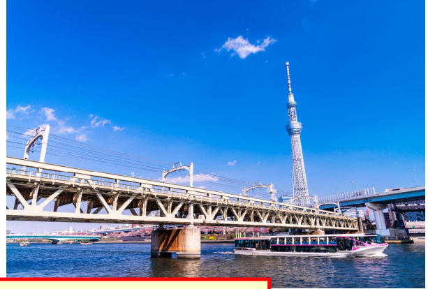
すみだ がわ てつきよう 「むかし」と「いま」の隅田川の鉄橋。