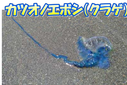
カツオ/エボシ(クラゲ)